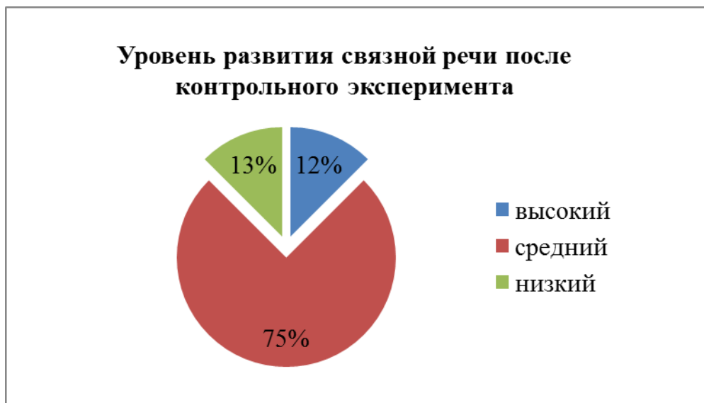
Рисунок 3 – Уровень развития связной речи после контрольного эксперимента

На рисунке 2 мы видим, что после реализации эксперимента в группе уровень развития связной речи детей существенно повысился, у большинства детей произошел существенный рост показателей