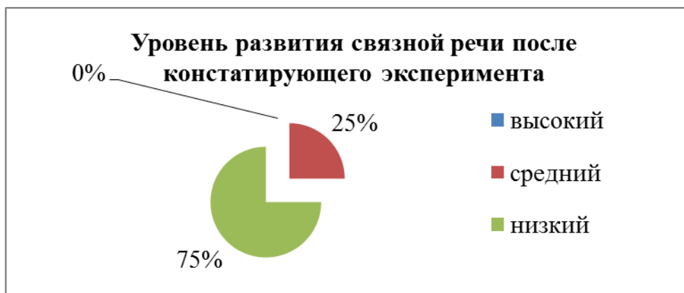
Рисунок 1 – Результаты констатирующего эксперимента

Таким образом, среди испытуемых преобладает в большей степени низкий уровень развития связной речи (75%). Связная речь таких детей характеризуется нарушением структуры текста, бедностью лексики. В тексте часты паузы, пропуски действий, отсутствуют уточнения деталей. Дети не могут справиться без наводящих вопросов логопеда.